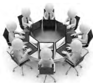
Runder Tisch Business