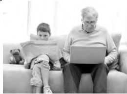
Old man using a laptop with his grand son reading a newspaper